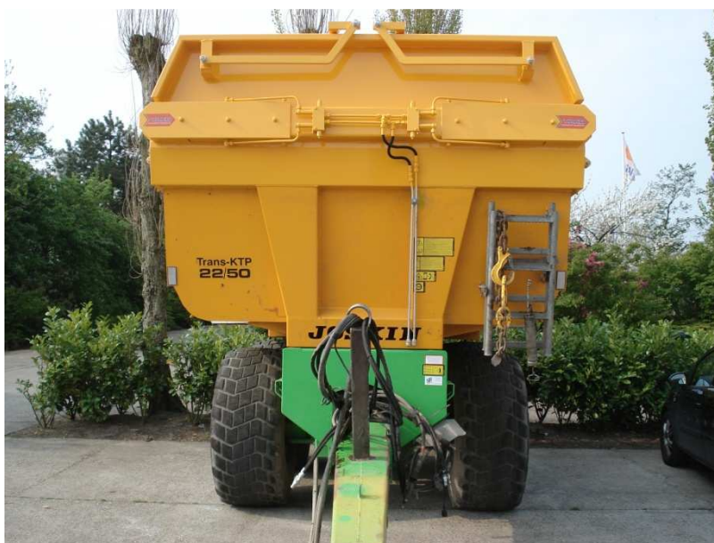
Figuur 2; aandrijfkasten