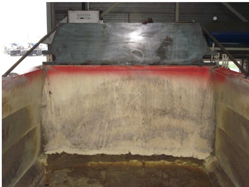
Figuur 1; kopschot plaatsen