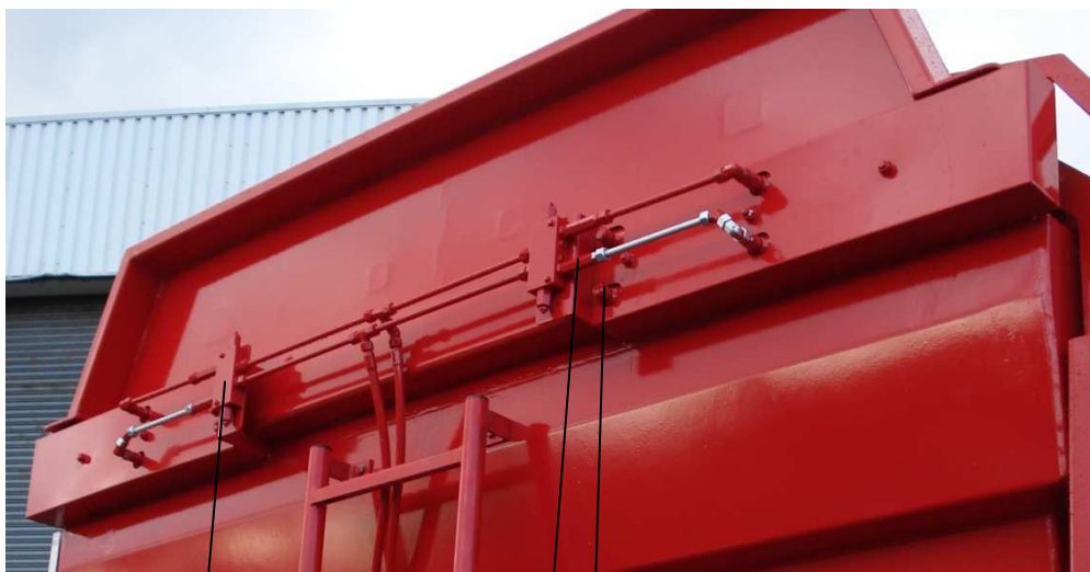
Figuur 5; Montage hydrauliek

Lasthoudventielen (2x): met "C" naar cilinders, met "V" naar ventiel.