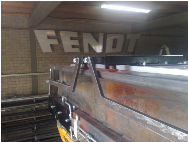
Figuur 10; steun onder stuurarm