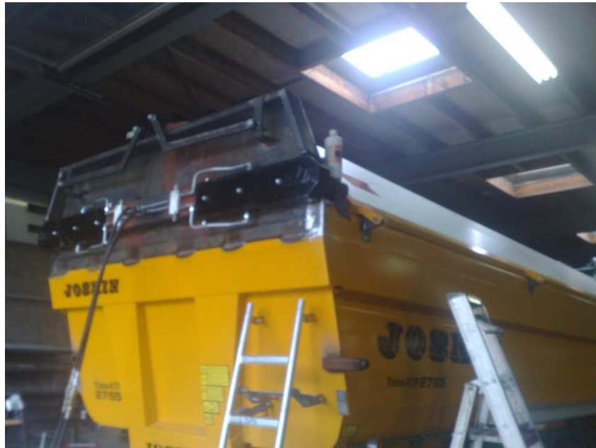
Figuur 7; M20 bouten t.b.v. stuurarm