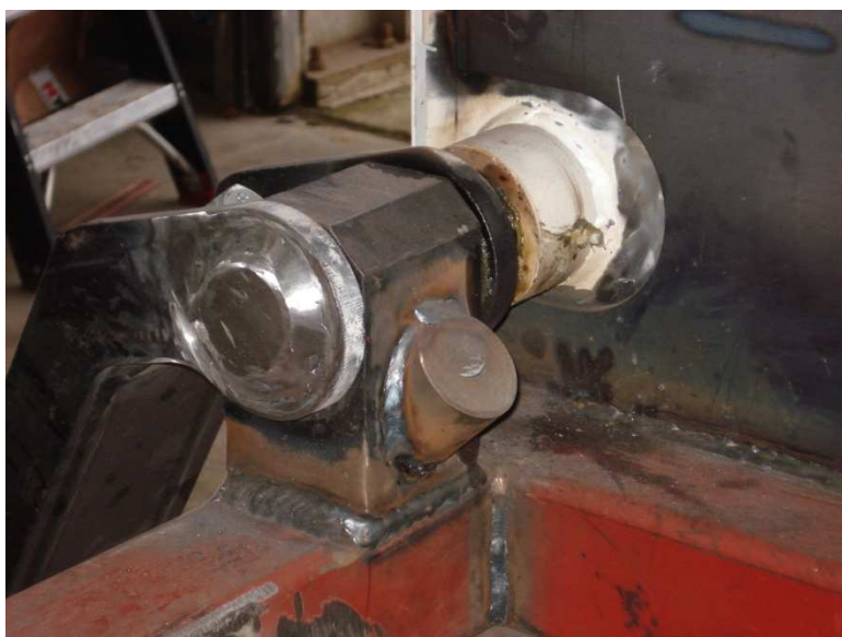
Figuur 11; wig aan lagerblok