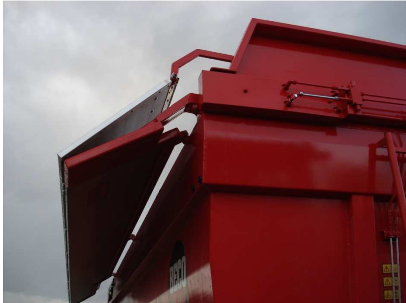
Figuur 6; bakrandscharnieren